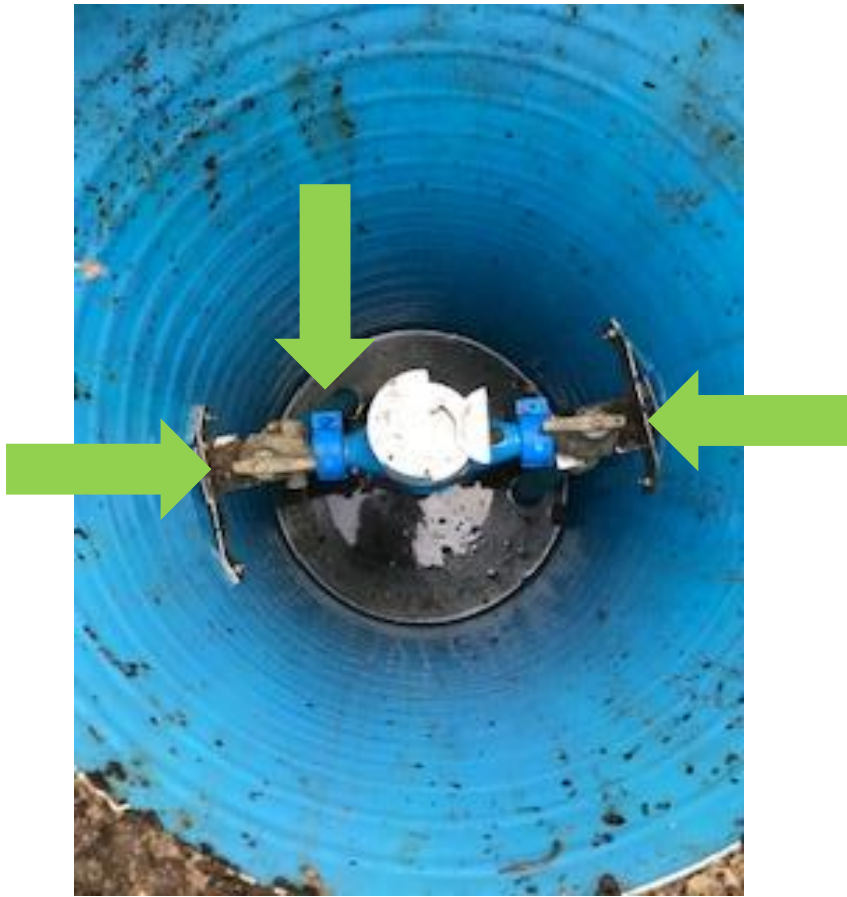
Her er der åbent for tilslutning til brønd og fra brønd til hus.

Der vil IKKE blive lukket for vandforsyningen som hidtil.